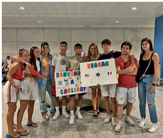
I ragazzi dello Scambio Giovani 2022-2023.