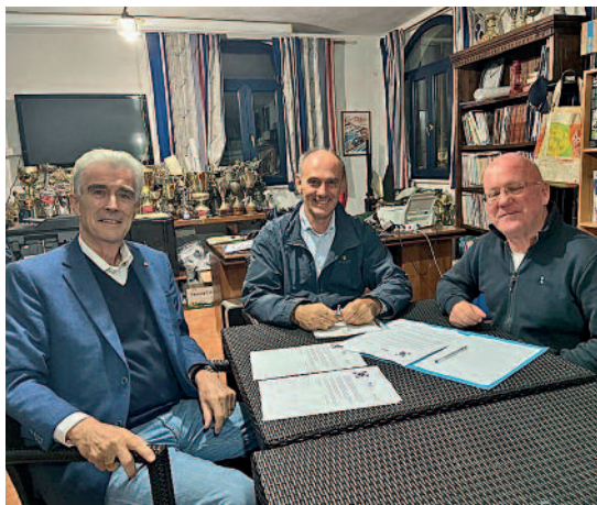
Firma dell'accordo con i Canottieri Ichnusa sulla Regata Internazionale 2023.

Nel corso dell'anno abbiamo collaborato attivamente anche con gli altri cinque Club della città metropolitana attraverso il Comitato InterClub (Co.In.). I sei presidenti si incontrano mensilmente per discutere e coordinare il lavoro dei singoli club e per pianificare attività congiunte per creare un maggiore impatto rotariano nella nostra città.