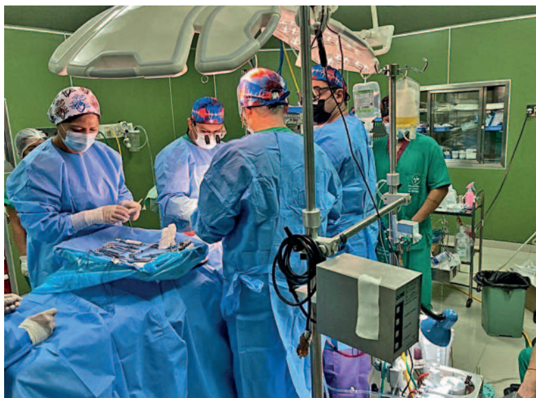
Intervento durante il Progetto Cuore Bolivia.

Gli argomenti trattati sono stati molto diversi. Le nostre conversazioni si sono con-