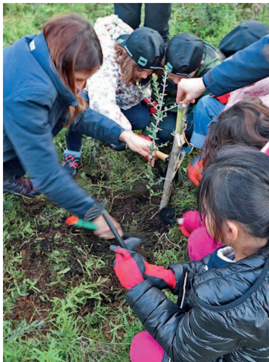
Ristoro e piantumazione di alberi a Sennariolo.