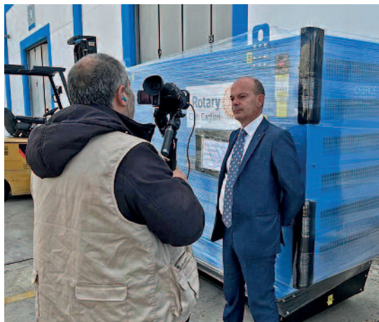
Consegna del generatore per l'Ucraina.